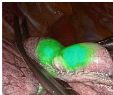
Coloration d'un nodule du lobe supérieur au vert d'indocyanine