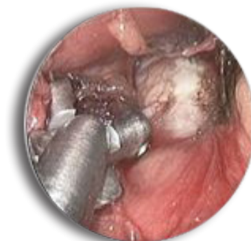
Prélèvement d'un ganglion au cours d'une médiastinoscopie

En fin d'intervention, un drain de petit calibre est parfois laissé en place quelques heures. L'incision cutanée est en général fermée par un fil résorbable ou de la colle biologique. Il est donc très rare que des soins infirmiers soient nécessaires après la sortie.