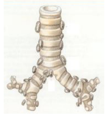
Représentation schématique de la trachée et des ganglions

Le médiastin est une région anatomique située dans la partie médiane du thorax, entre les deux poumons. Cette région comprend le cœur, de nombreux vaisseaux, des organes vitaux comme la trachée ou l'œsophage, et des ganglions lymphatiques.