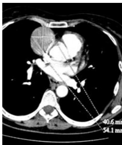
Thymome encapsulé : scanner