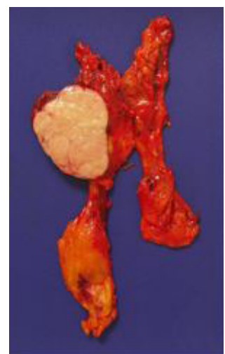
Thymome encapsulé : pièce de thymectomie complète