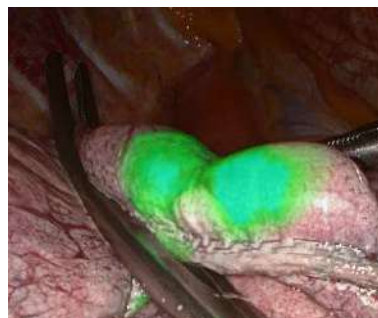
Coloration d'un nodule du lobe supérieur au vert d'indocyanine