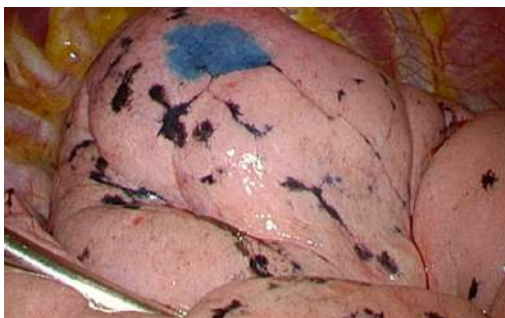
Coloration d'un nodule du lobe supérieur au bleu de méthylène

L'ensemble du matériel est retiré et l'intervention chirurgicale va se poursuivre : résection atypique (encore appelé wedge), segmentectomie ou lobectomie. Vous pouvez vous reporter aux fiches d'information correspondantes.