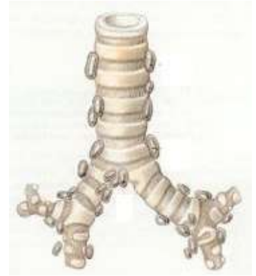
Représentation schématique de la trachée et des ganglions

Le médiastin est une région anatomique située dans la partie médiane du thorax, entre les deux poumons. Cette région comprend le cœur, de nombreux vaisseaux, des organes vitaux comme la trachée ou l'œsophage, et des ganglions lymphatiques.