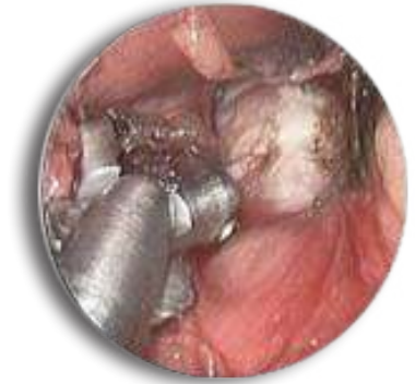
Prélèvement d'un ganglion au cours d'une médiastinoscopie

En fin d'intervention, un drain de petit calibre est parfois laissé en place quelques heures. L'incision cutanée est en général fermée par un fil résorbable ou de la colle biologique. Il est donc très rare que des soins infirmiers soient nécessaires après la sortie.