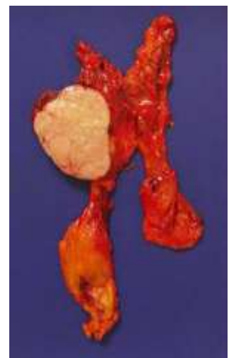
Thymome encapsulé : pièce de thymectomie complète